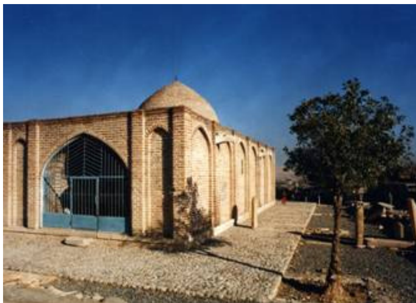
نمای بیرونی مقبره ب‌آق سلطان - مه‌آباد