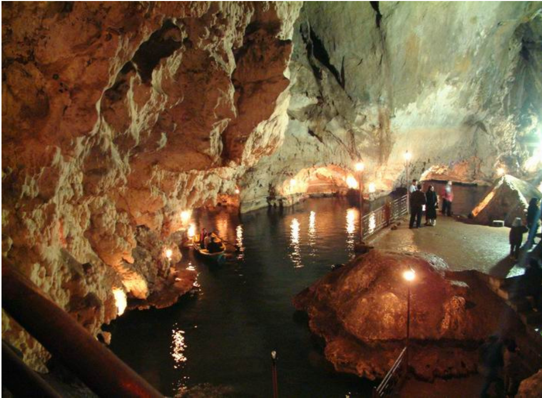
تصاویری زیبا از غار سهولان مهاباد