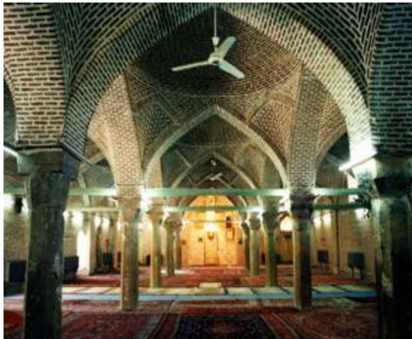
مسجد جامع (مسجد سرخ) - مه‌آباد

زیباترین و جالبترین اثر تاریخی بجای مانده از دوران صفوی در منطقه غرب و شمال غرب ایران مسجد جامع مه‌آباد یا مدرسه شاه سلیمان می‌باشد که به مسجد سرخ نیز معروف است و اکنون در قلب شهر قرار گرفته است و خطبه های نماز جمعه شهر در آن برگزار می‌شود ، این مسجد که اساساً به عنوان مکان تعلیم علوم دینی آن زمان در شهر مه‌آباد که قدیمی ترین و متمرکزترین شهر منطقه بوده بوجود آمده است در زمان شاه سلیمان صفوی و فرمانروایی تنها سلطان و حکمران نیکوکار منطقه کردستان یعنی بداق سلطان در سال ۱۸۰۹ هجری قمری ساخته شده است .