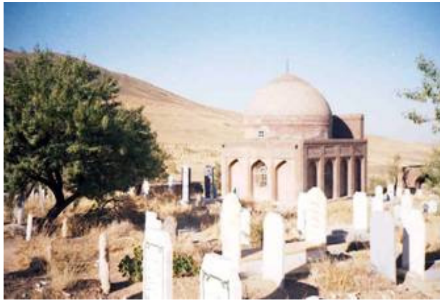
نمای بیرونی مقبره شمس برهان - مه‌آباد