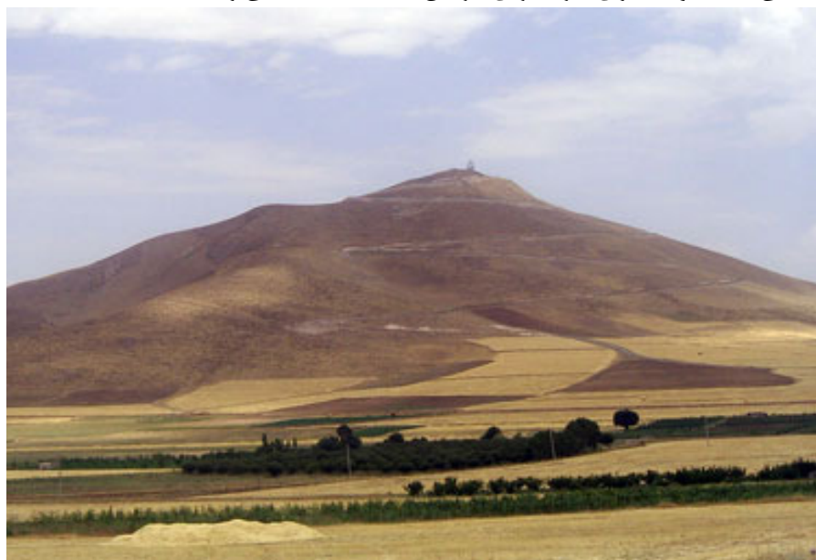
کوه سلطان - مهاباد

کوه سلطان کوه کم ارتفاعی است که در مسیر مهاباد به بوکان و نرسیده به غار سهولان واقع شده است. طبق گفته افراد محلی ، در زمان نه چندان دور این کوه قداست خاصی داشته و بسیاری افراد برای گرفتن حاجت به آنجا می رفته اند.