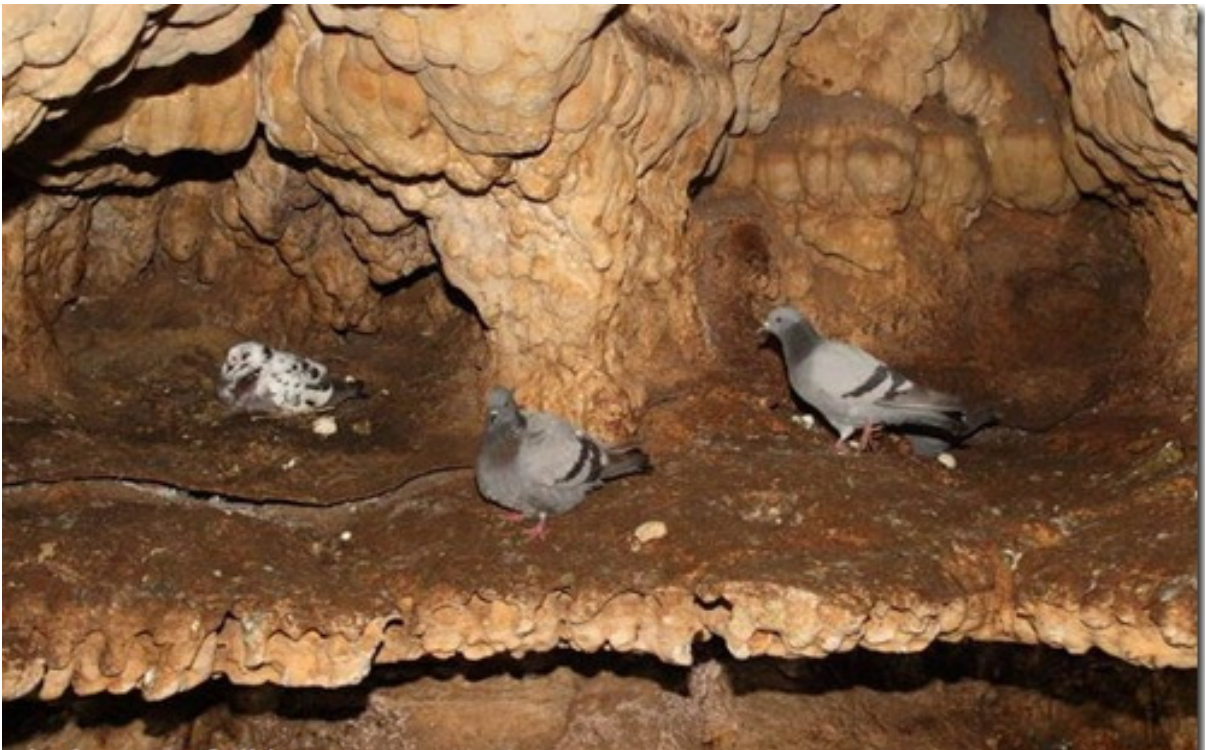
کبوتر چاهی در غار سهولان