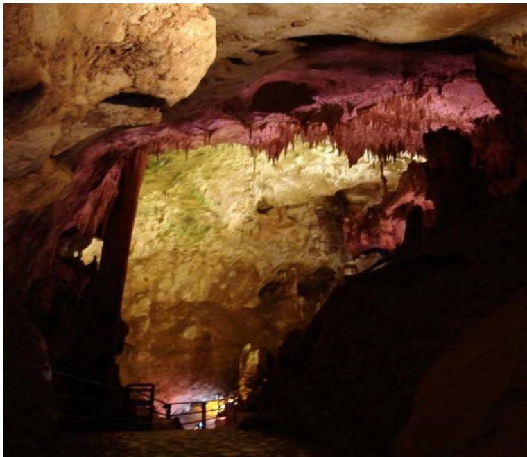
تصاویری زیبا از غار سهولان مهاباد

غار سهولان، دومین غار آبی کشور (پس از غار علیصدر همدان) است که در روستای سهولان نزدیک شهرستان مهاباد واقع شده است. غار سهولان از مهمترین غارهای طبیعی ایران علاوه بر وجود یک حوضچه بزرگ آبی با مناظر فوق العاده دیدنی، در گذشته های دور محل سکونت انسانها نیز بوده است. شفافیت بیش از حد آب دریاچه زیرزمینی این غار به حدی است که در صورت وجود نور کافی می توان تا ده متر را نیز مشاهده کرد و این شفافیت حاکی از این است که آب این قسمت از نوع اکسیدان بوده و به علت عدم نور کافی و سایر فاکتورها موجود است که این بخش از غار به صورت یک اکوسیستم درنیامده است. تنها موجودات زنده ای که در داخل غار سهولان زندگی می کنند، یک نوع کبوتر چاهی از نوع بریتیش کلمبیا و یک نوع خفاش کوچک است. عمق دریاچه این غار حداقل ۱۲ متر و حداکثر ۲۵ متر است. اکسیژن کافی در این غار وجود دارد و با کمی توجه می تواند یکی از شگفت انگیزترین غارهای ایران باشد.