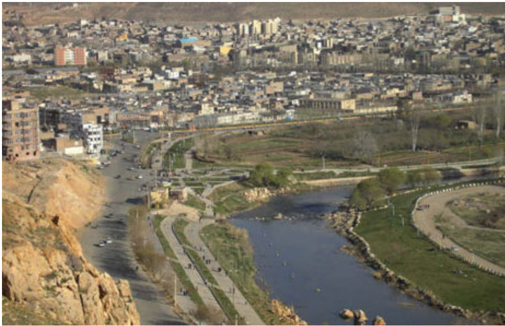
منظره ای از شهر و رودخانه مه‌آباد