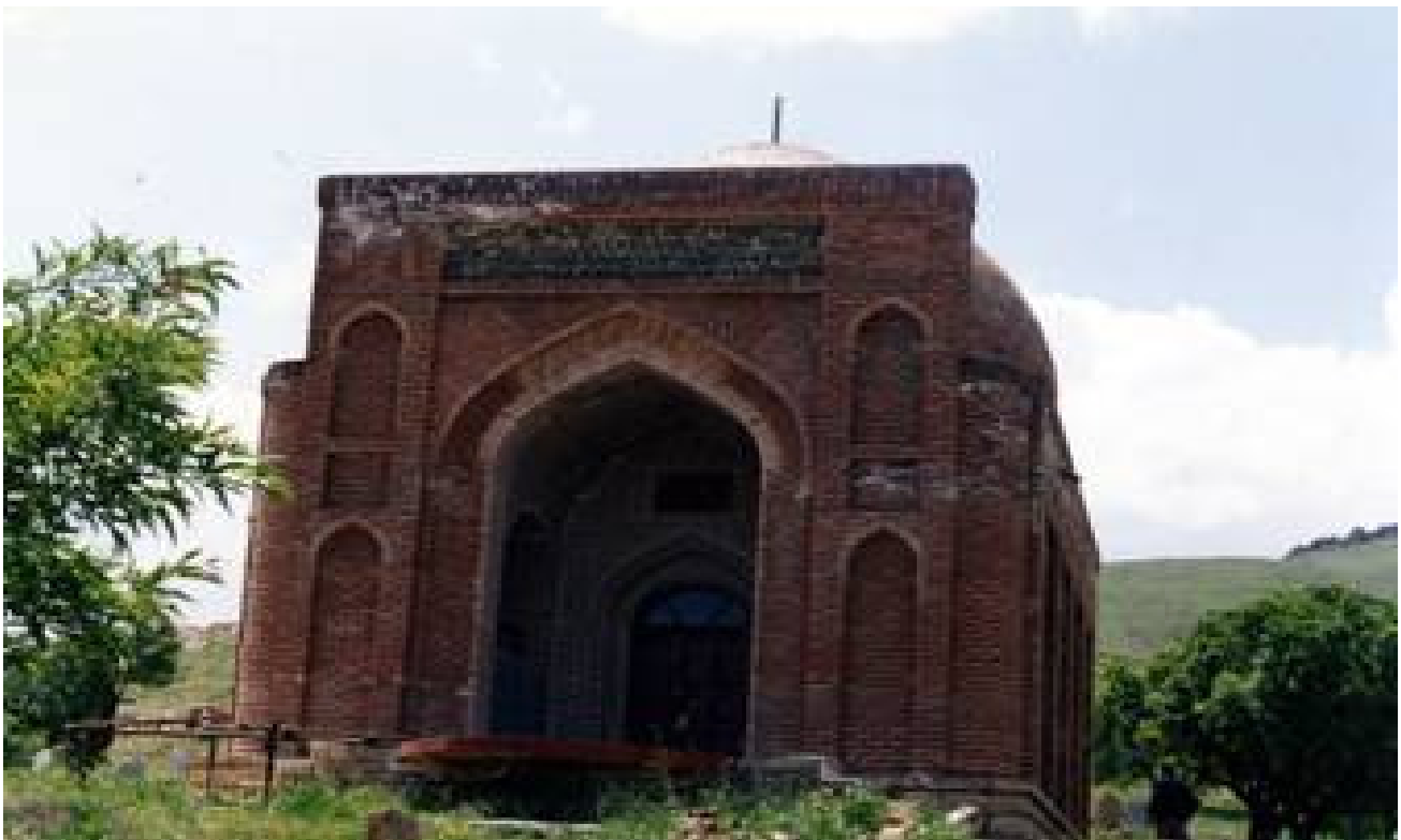
نمای بیرونی مقبره شمس برهان - مهاباد

رقد شمس برهان در روستای خانقاه و در منطقه سردسیر قرار دارد. این مرقد در ۳۵ کیلومتری جاده مهاباد به بوکان در سمت راست جاده مذکور در یک راه فرعی بطول تقریبی ۷ کیلومتر قرار دارد. بنا به اظهار روحانی روستا که متولی مرقد و نوه شمس برهان است و نیز شیوه های معمول در صدفه سازی و ساختمان سازی و بکارگیری تزئینات دو طرف ایوان قدمت بنا بیشتر از ۱۰۰ سال به نظر می رسد ، ولی تعیین قدمت و تاریخچه دقیق آن در اثر مطالعات بیشتر ، میسر می باشد . ساختمان بنا بصورت چهارگوش بوده و مصالح بکار رفته در آن عبارتند از سنگ های آهکی تراشیده شده و تیرهای قطور چوبی که دارای سقفی مسطح است . تهویه درونی و نور داخل مقبره بواسطه پنجره هایی که در شمال و جنوب آن تعبیه شده انجام می پذیرد ، لبه بام از چهارضلع با چوب بصورت کنسول ساخته شده و در داخل ایوان دو طاقچه بصورت گچبری مشاهده می شود ، جبهه درونی با اندود گچ ساده و جبهه خارجی بوسیله سنگهای تراشدار تزئین داده شده است . این مکان مذهبی محل اجتماع مریدان و سالکان طریقت نقش بندی است .