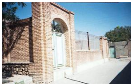
نمای بیرونی مقبره سردار بوکان

این بنا در شهر بوکان در داخل پارک عمومی قرار گرفته است و مربوط به دوره قاجاریه می باشد. زیربنای مقبره در سطح ۱۹۸ مترمربع بوده است و دارای یک گنبد مرکزی، ایوان و دو دهلیز در طرفین می باشد. در ضلع جنوبی که ورودی بنا را تشکیل می دهد، ایوانی با ۲ ستون سنگی قرار گرفته است که زیبایی خاص به مجموعه داده است، مقبره مذکور مدفن خانواده سردار « عزیز خان مگری » داماد امیرکبیر و فرمانده کل قشون ناصرالدین شاه قاجار می باشد که مورد توجه امیرکبیر بوده است.