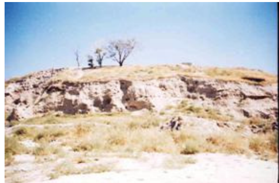
کل تپه - بوکان

تپه ای باستانی است که در حال حاضر بوسیله واحدهای ساختمانی احاطه گردیده است این تپه در روستای کل تپه در جنوب بوکان قرار گرفته است که این روستا به خاطر وجود چشمه های متعددی در کنار این تپه باستانی بنا گردیده است که نام روستا هم برگرفته از نام تپه است . ارتفاع نسبی این تپه از ۳۰ تا ۴۰ متر بیشتر نمی شود شامل بقایایی از فرهنگ انسانهای دوران ماد می شود و علت اصلی انتخاب این انسانها برای سکونت به احتمال قوی مسائل امنیتی و تدافعی بوده است . از آنجا که آذربایجان غربی و بویژه کناره های دریاچه ارومیه مرکز آتشکده ها و آیین های ایران کهن بوده است قدمت کل تپه هم به زمانی بر می گردد که در آن جا آتشکده هایی بوده است و نشانی از آتش را در خود پنهان دارد.