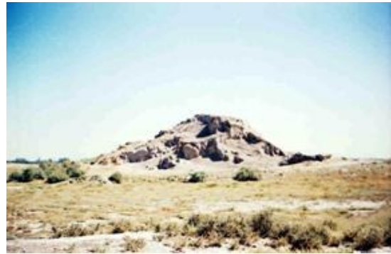
تپه عباس آباد (قلعه داش تپه) - بوکان